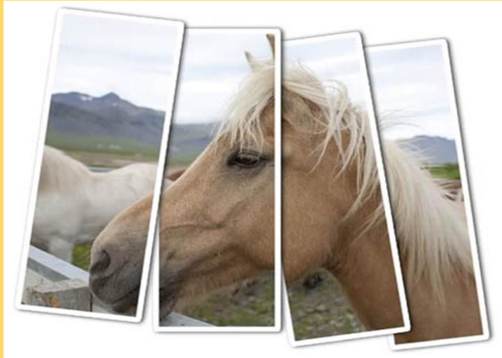
Imagen de Cursos en HD

Juego ideal para divertirse con la familia en casa y también en la terraza ahora que hace buen tiempo. Pueden participar desde 2 a 20 jugadores.